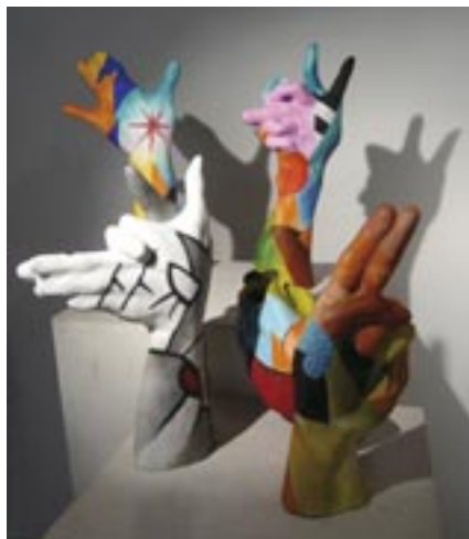
Œuvre de Vong