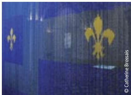
Installation salle des religieuses