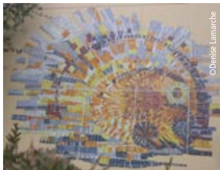
Œuvre de Jean-Paul Froidevaux Collège La Taillette à Menucourt

Venez découvrir les œuvres d'artistes dans notre environnement quotidien !